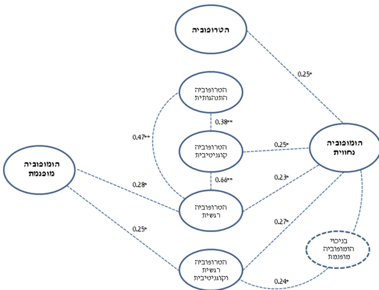
תרשים II תיאור הקשרים בין שלושת המשתנים: הטרופוביה, הטרופוביה מופנמת והטרופוביה נחוית ותיאור הקשרים בין שלושת המימדים של הטרופוביה עם הטרופוביה נחוית והטרופוביה מופנמת. * P < 0.05 , ** P < 0.01